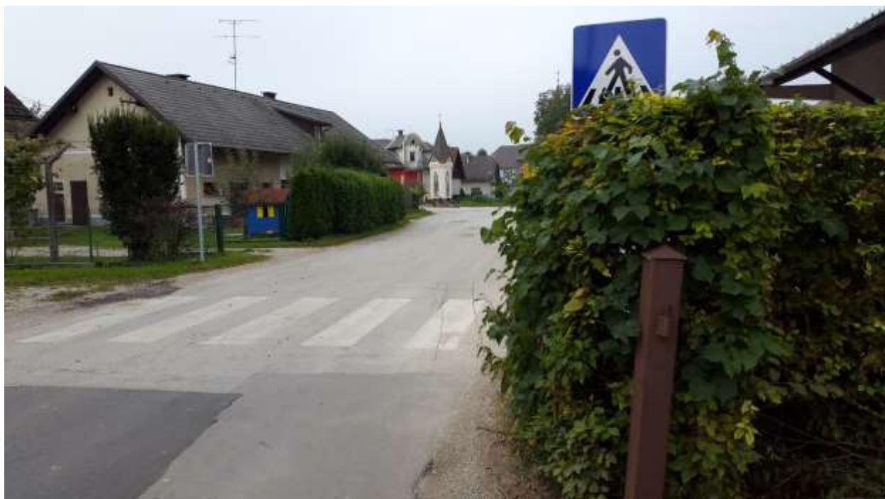
Slika 2: Slaba preglednost pri prehodu za pešce pri vhodu v Trboje iz smeri Vokla.