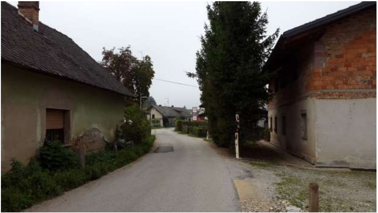
Slika 3: Preozek prihod (cesta) v Trboje iz smeri Vokla.