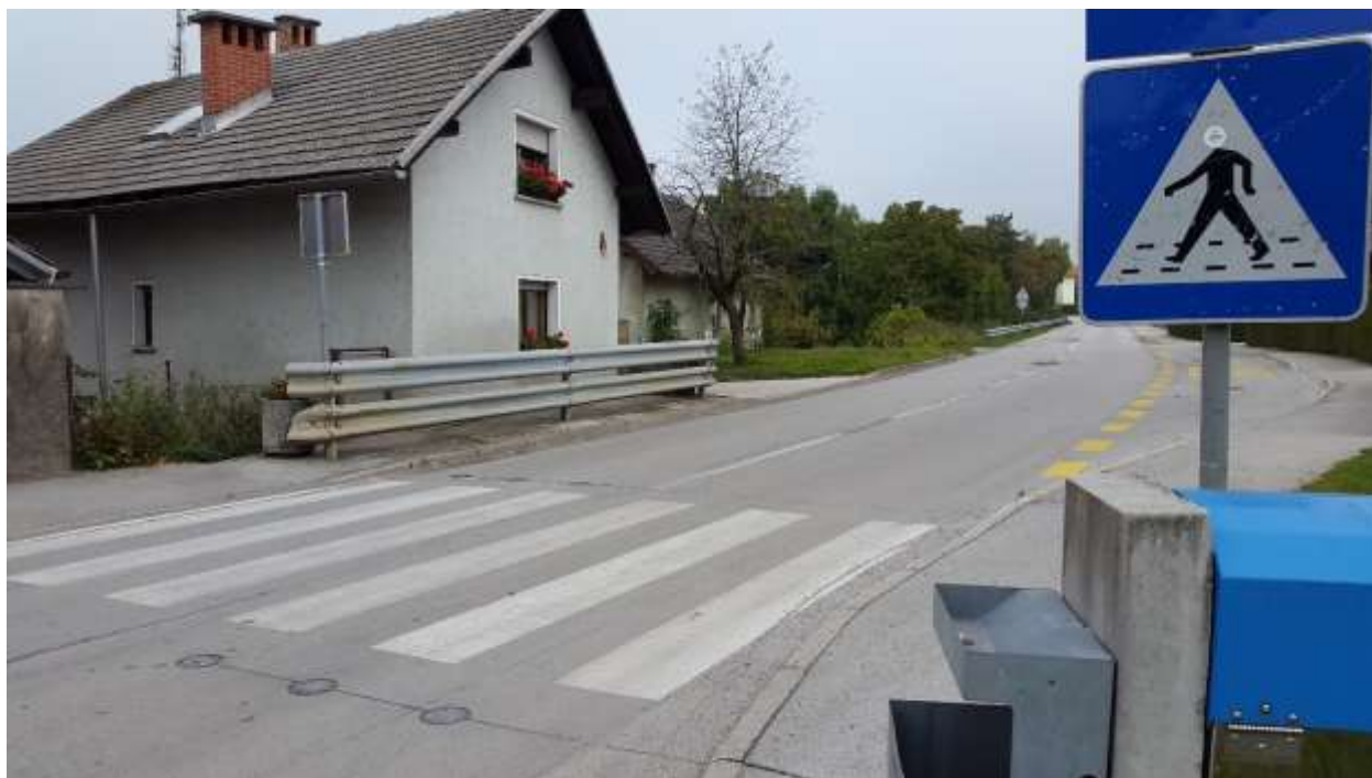
Slika 1: Nepregledno križišče v Trbojah – slabo viden prehod za pešce, če se pripelješ iz Vokla.