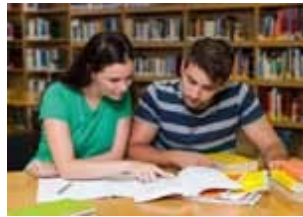
Metka in Uroš