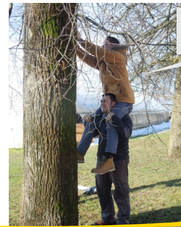
Urh in Žiga: »Skupaj zmoreva!«