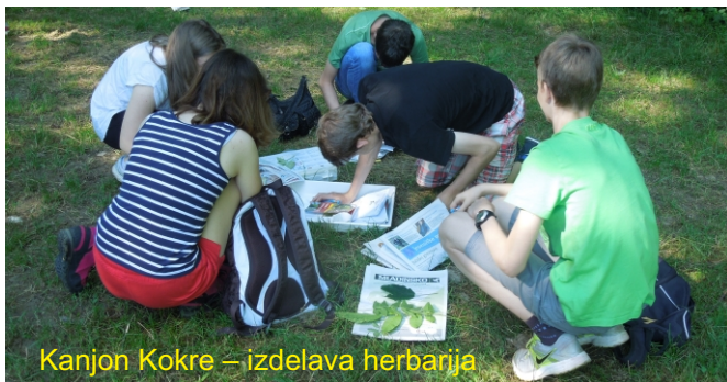
Kanjon Kokre – izdelava herbarija